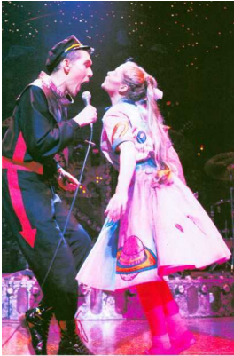
Il Pianeta Proibito - un'immagine dell'edizione inglese

Lo spettacolo nasce a Londra nel 1988 da un gruppo di teatro sperimentale ed è ambientato, in un futuro da fantascienza, a bordo di un'astronave della quale gli spettatori sono anche i passeggeri e, nonostante l'insieme della narrazione ricalchi l'omonimo film cult del 1956 il musical segue una strada sua. Sembrerebbe un mix inconciliabile ma forse proprio qui sta il segreto del successo di questo musical così unico ed originale